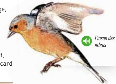
Pinson des arbres