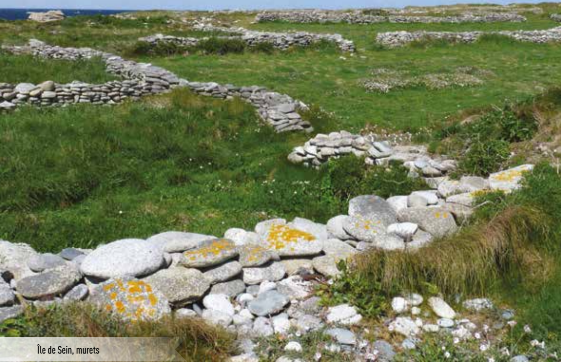
Île de Sein, murets