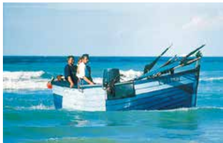
Le fond du flobart peut être presque aussi large que long

Le flobart* est massif à l'avant et possède un tirant d'eau réduit au minimum. Il utilise le gréement de bourcet-malet, commun à la plupart des bateaux de la région au temps de la voile et, cas unique en Europe occidentale, dispose d'une dérive centrale en puits. Beaucoup de ces embarcations ont aujourd'hui disparu ; elles font partie des derniers bateaux de plage français !