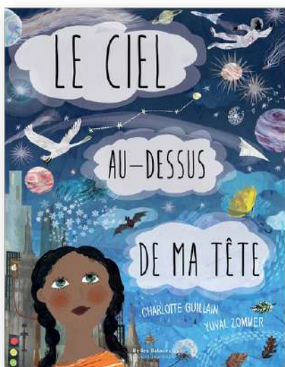
► Visuel couverture - extraits

Format : 25,6 x 33,1 cm, 20 pages en accordéon - 24,90€