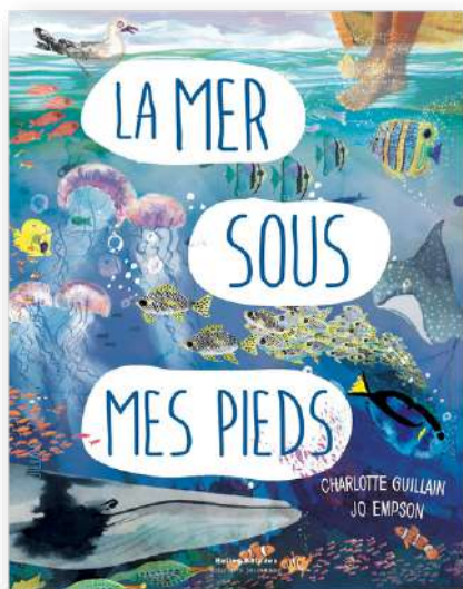
► Visuel couverture - extraits

Trois livres accordéon qui fonctionnent sur le même principe : une page qui se déplie à mesure que l'on s'élève dans le ciel ou que l'on s'enfonce sous la terre ou sous la mer, pour découvrir des informations fascinantes sur ces univers.