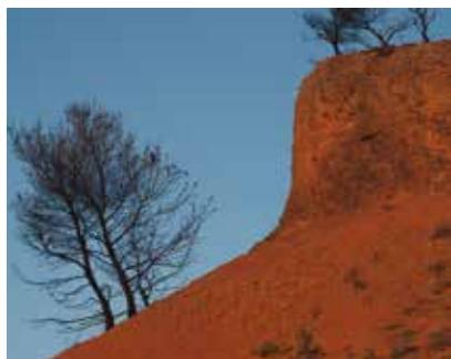
Les Collets rouges

Vous retrouvez l'asphalte dans le vallon, effleurez en remontant la fraîcheur d'une retenue comblée de colluvions et de roseaux. Sur le départ, vous surprenez un circaète Jean-le-Blanc ou un aigle de Bonelli venus chasser, l'un les reptiles, l'autre les perdrix ou les lapins dans ces parages découverts.