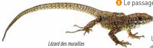
Lézard des murailles