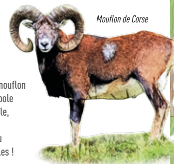
Mouflon de Corse

Le massif de Bavella abrite, avec celui du Monte Cinto, le mouflon de Corse. Ce mammifère, symbole de la faune montagnarde de l'île, est difficile à apercevoir. En été, il se déplace surtout au coucher du soleil. À vos jumelles !